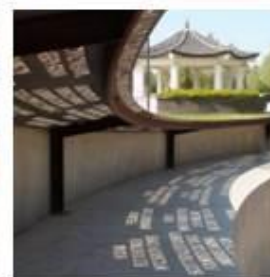
採用具備「創造精神」及工業特色的設計元素，將藝術融入公園當中，如特色座椅及涼亭。