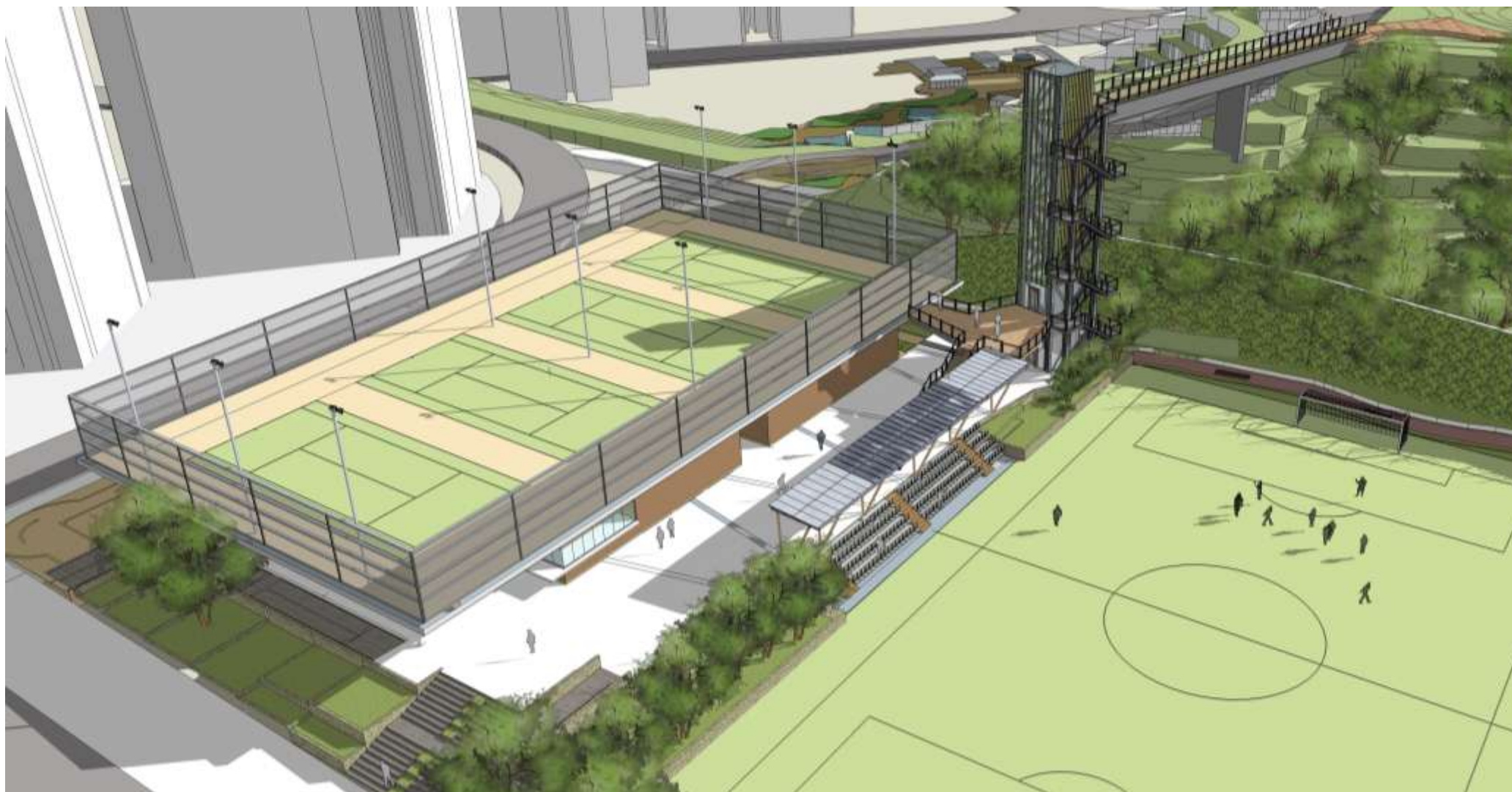
連接康寧道公園至牛頭角配水庫頂 透視圖像