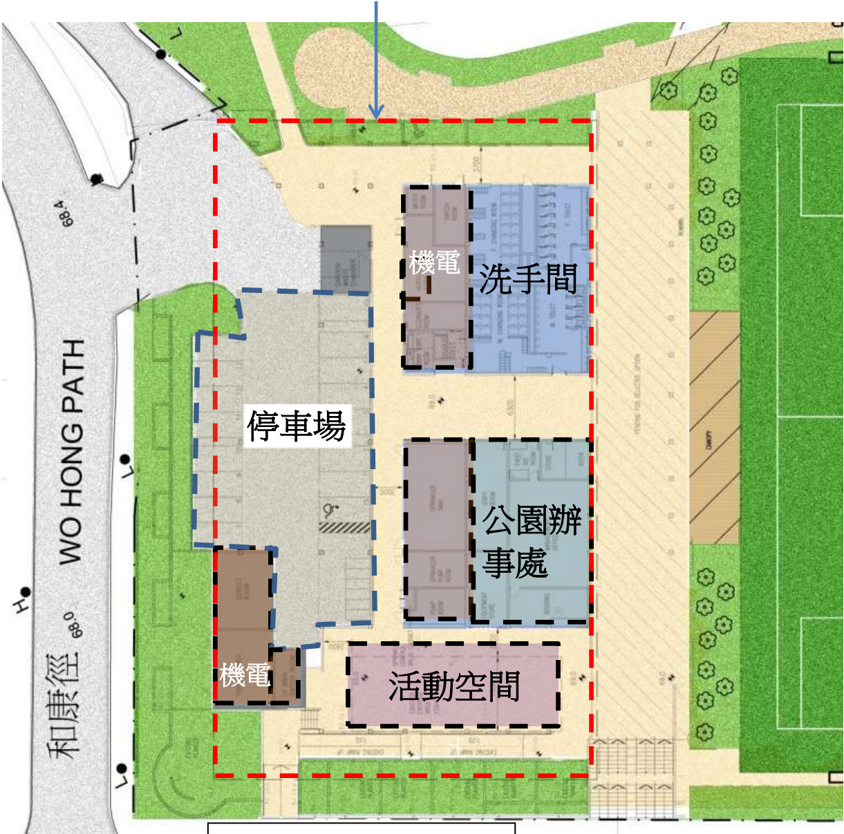
管理辦公室及洗手間設計圖