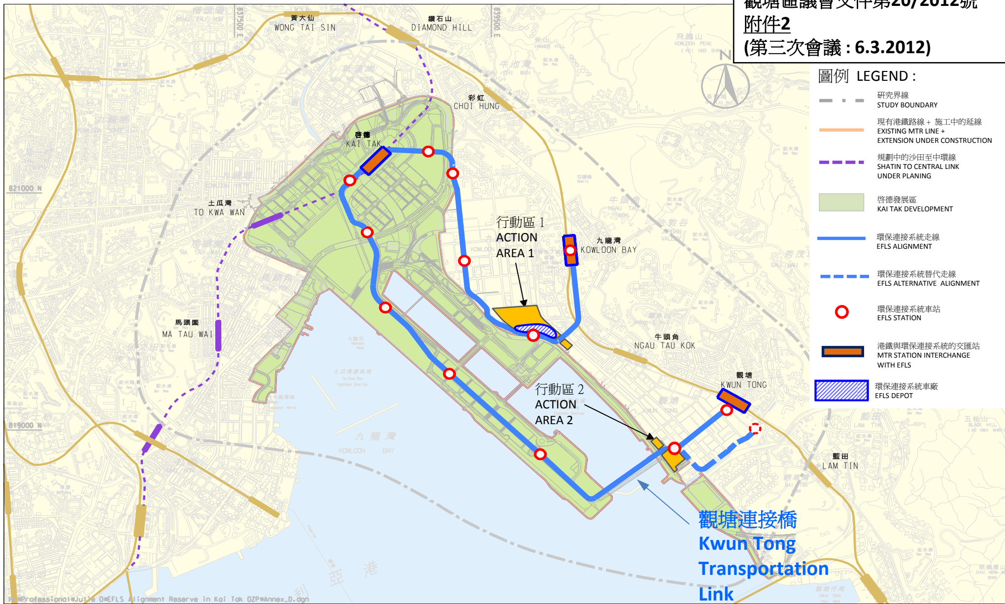
環保連接系統的建議走線圖