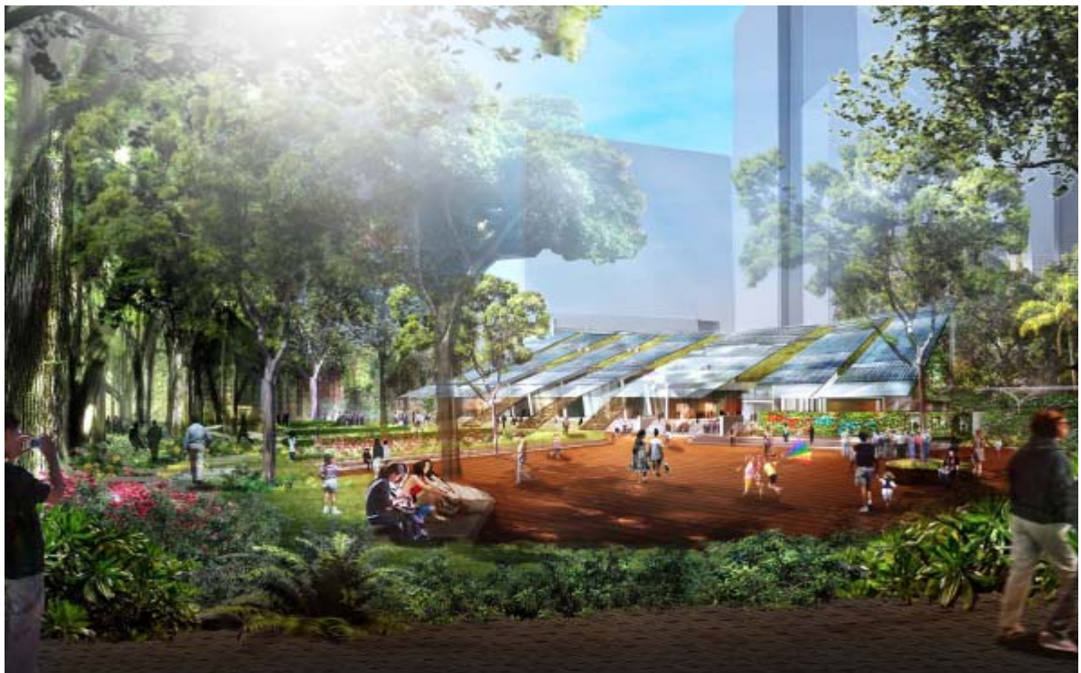
Zero Carbon Building cum public open space