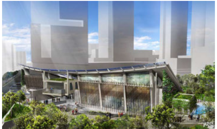
Zero Carbon Building